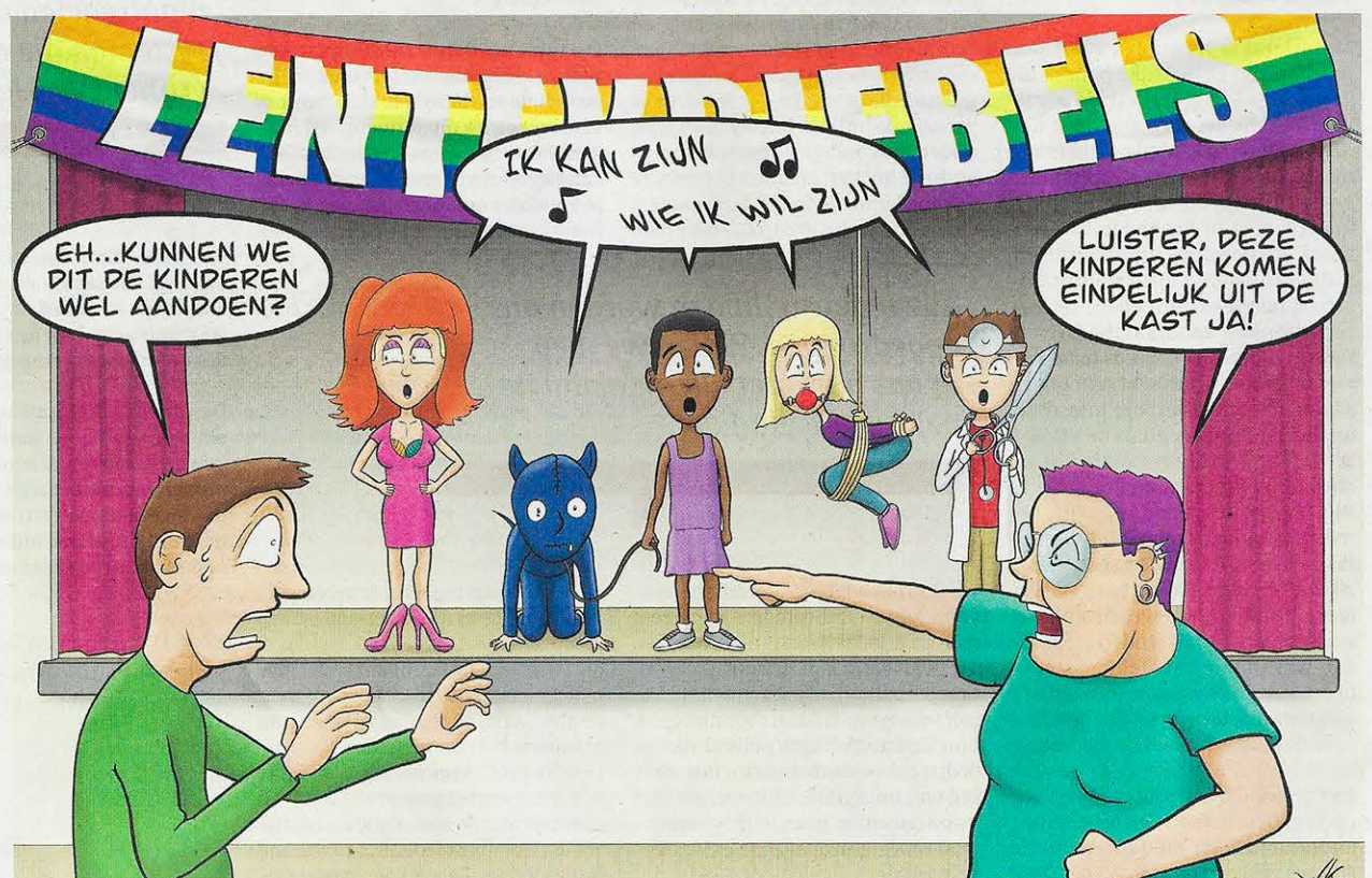
Illustratie: Wilfred Klap

► Luister het hele interview op: youtube.com/@deanderekrant Website van Hans Koppies: pedagogoogle.com